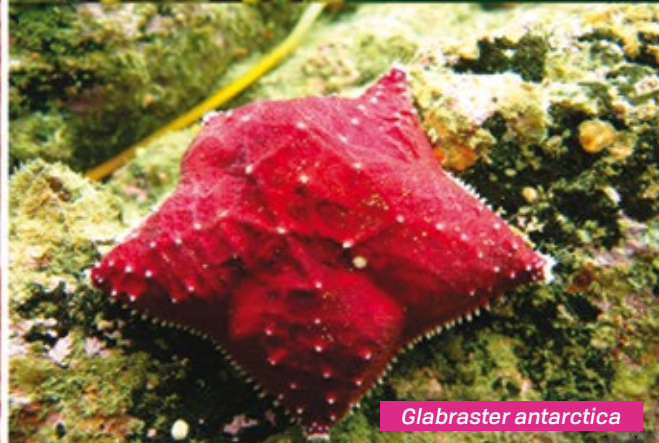
Figura 3: A- Procesamiento del material en el laboratorio de la UNTDF; B- algunas de las especies identificadas en el Parque Nacional Tierra del Fuego: (BEN), Sáenz Valiente (BSV), Chica (BCH), Achicoria (BAC) e isla Redonda (BRE).