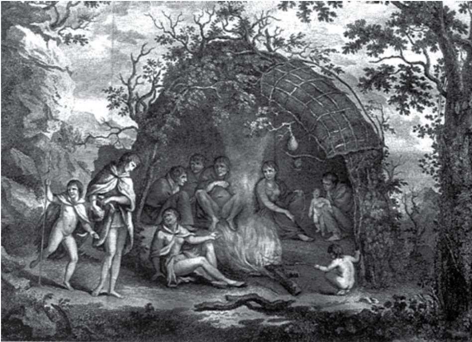
Campamento Haush avistado por la expedición de James Cook, según grabado de la época.

sentantes de una hipotética "primera oleada" migratoria a Tierra del Fuego, posteriormente relegados a estas inhóspitas tierras por poblaciones con tecnologías más efectivas y más agresivos.