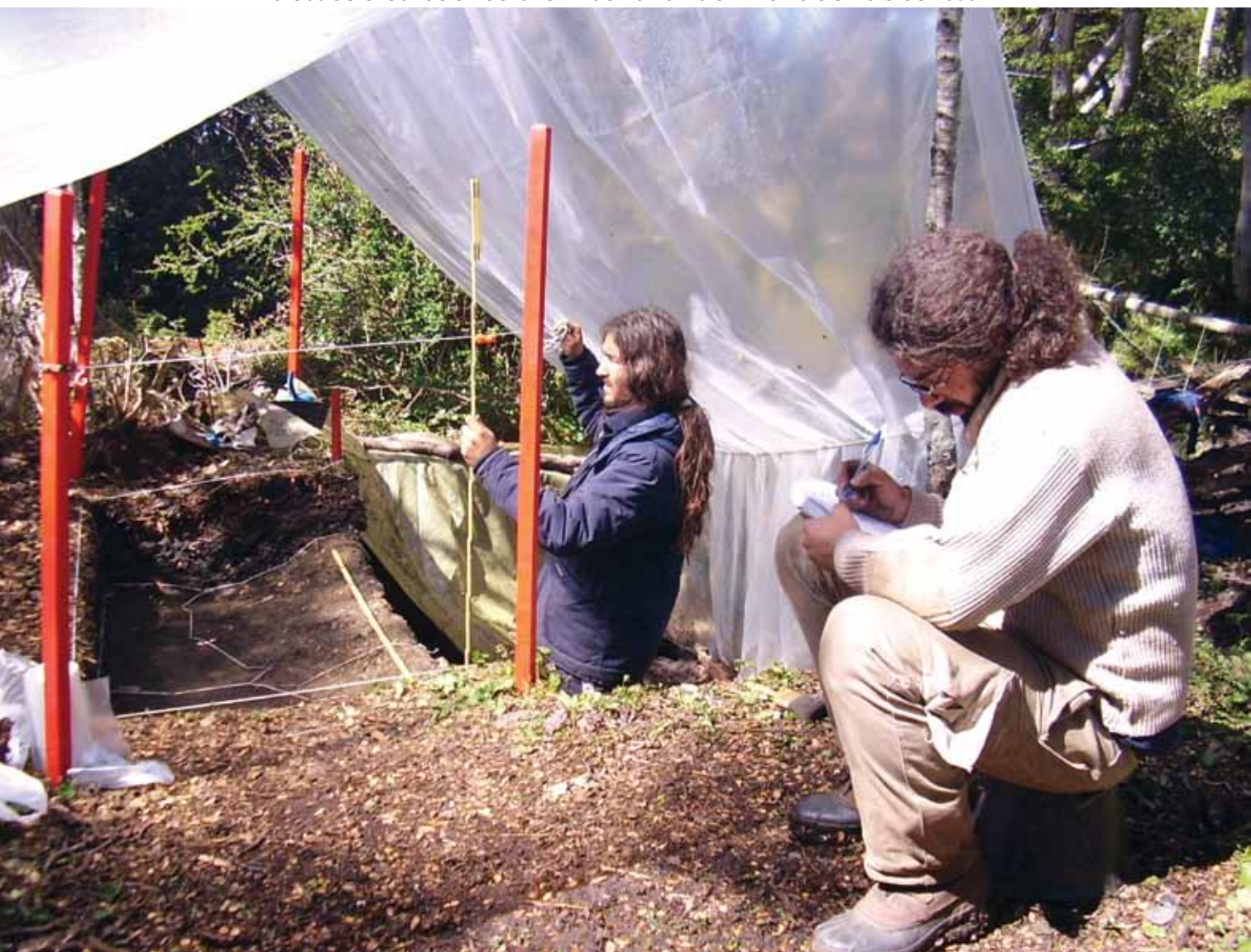
Tareas de excavación del Sitio 11 de Bahía Valentín en diciembre de 2006

Primeros Pobladores: la información de estas ocupaciones proviene de un solo sitio: BVS11, donde se fecharon ocupaciones entre los 5900 y los 4300