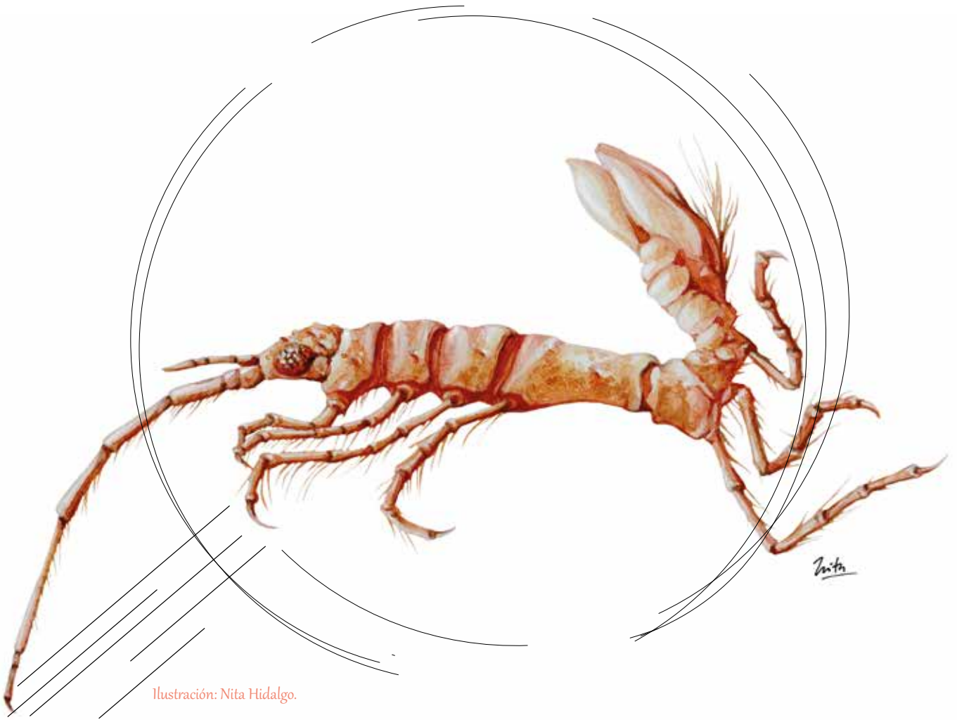
Ilustración: Nita Hidalgo.