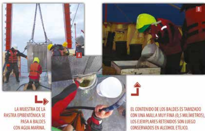
Figura 3. Cuando la rastra epibentónica (A) llega a la cubierta, se recoge su contenido en baldes e inmediatamente después se recuperan los ejemplares tamizando la muestra (B). Su contenido se almacena en frascos más chicos que llegan al laboratorio.