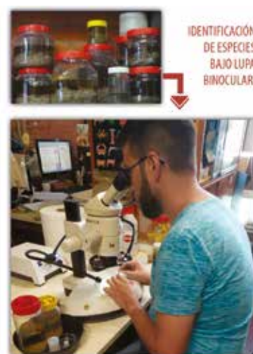
Figura 4. Separación de ejemplares bajo lupa binocular.

malla muy fina (0,5 milímetros). Los peracáridos quedan retenidos en el tamiz (FIGURA 3B), y luego son conservados en frascos con alcohol etílico diluido al 70% para estudios taxonómicos, o en alcohol puro para estudios de ADN. En el laboratorio, los peracáridos son separados de los demás invertebrados utilizando una lupa binocular (FIGURA 4). Finalmente, para identificar a las distintas especies, en muchos casos se requiere hacer disecciones de los apéndices (patas, antenas o piezas bucales), para luego observarlos con más detalle bajo un microscopio de mayor aumento.